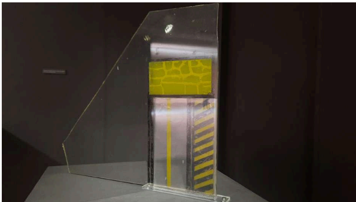
Maqueta de diseño para la puerta de la galería Arte Nuevo, Buenos Aires.