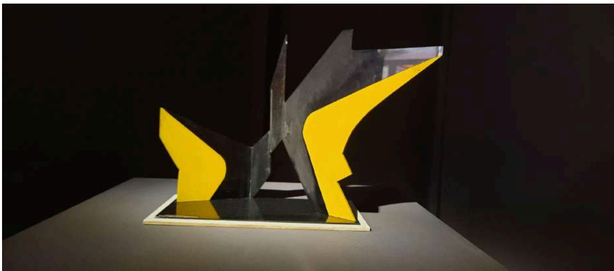
Transposeña , 1971

Más adelante, la escultora abandona el uso del acrílico para continuar trabajando con la chapa de hierro, ya que decide que es el material que mejor se adapta a sus necesidades expresivas.