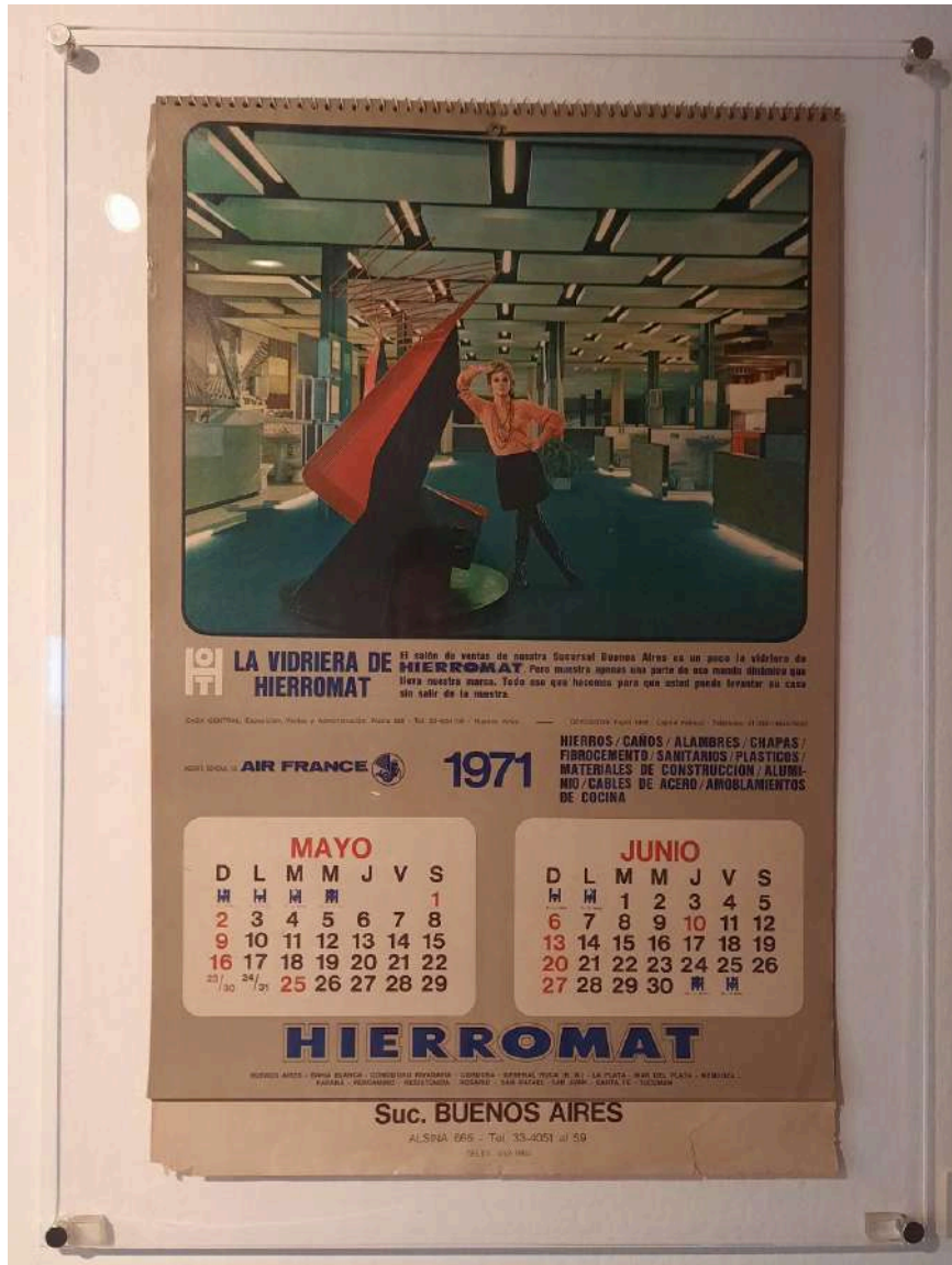
Calendario de la empresa Hierromat, que muestra la obra Hierroform emplazada en sus oficinas, 1971.